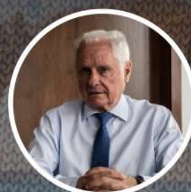
Hugo Borrel Frigorífico Arre Beef