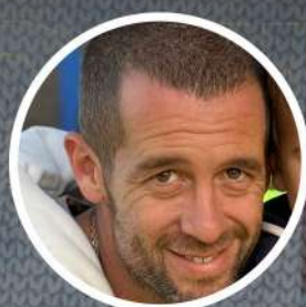
Santiago Lobo Frigorífico Riopaltense