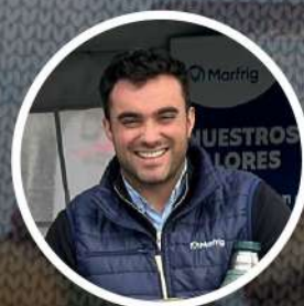
Santiago Marchisio Frigorífico Marfrig